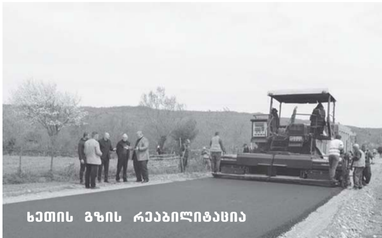
სეითის გზის რეაბილიტაცია

საჯიჯაოს ადმინისტრაციულ ერთეულში (ზუბის უბანი, ენანეიშვილის ეზოს მიმდებარედ) სანიაღვრე არხის რეაბილიტაციის სამუშაოები;