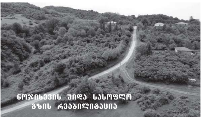
ნოჯიხევის შიდა სასოფლო გზის რეაბილიტაცია

ბატონო ვია, არავინ არ არის დაზღვეული სტიქიუ-