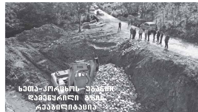
სეითა-ქორცხოს უბანში დამაყვრილი გზის რეაბილიტაცია

–ბედნიერებას, წარმატებას და მშვიდობიან გარემოში ცხოვ-