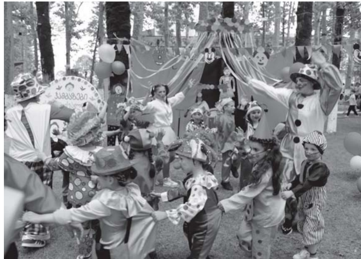
ცოცხლის მომავალზე გარემოს ვეწვლა და ვეწვლაფერი აბრწყინებდა... ასეთი ლამაზი დღეები არ მოშლოდეთ პატარებს...

უხაროდა დიდ პატარას... გამორჩეულად ლამაზ, სი-