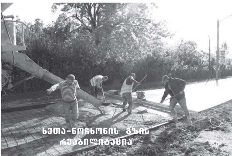
სეითა-ნოჩხონის გზის რეაბილიტაცია