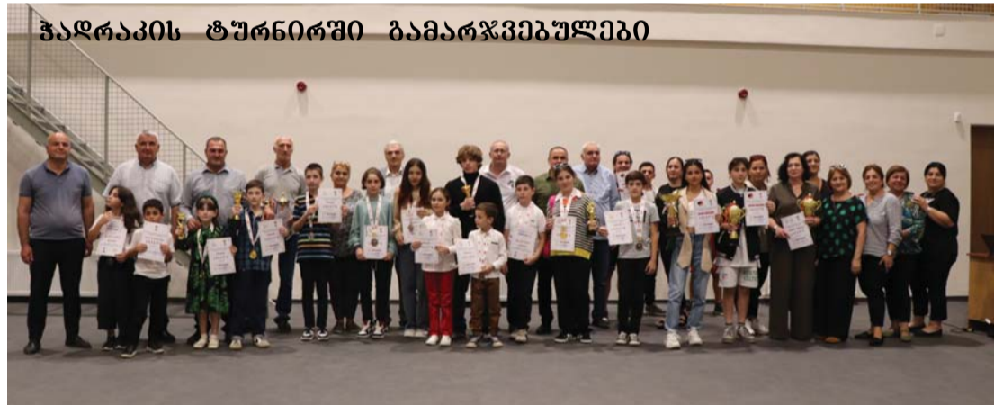
ჭადრაკის ტურნირში გამარჯვებულები

მოვიცანთ იის ცისთვალა ყონებს, რომ იდგეს ახლა ყიფიწყების ფაში. იას მოპყეება სურსელი სიყრმის და დავაფინსებთ ყველაფერს წამით. მოვიცანთ იის სამცეცა ღიმილს- მოწაფეობის ყაფისფერ ყაბით და შხეში ნახან ცყემლის ყფაფილგებს. აფეთქებულგებს მოფარნიან ღამით. მოვიცანთ იის ცისთვალა ყონებს რომ იდგეს ახლა ყიფიწყების ფაში... ლია ერქვანია