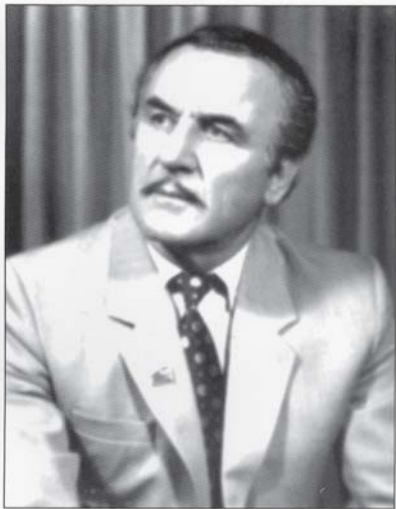
ვაჟა ეგრისელი ვაჟა-ფშაველას პრემიის ლაურეატი, პოეტი-აკადემიკოსი.